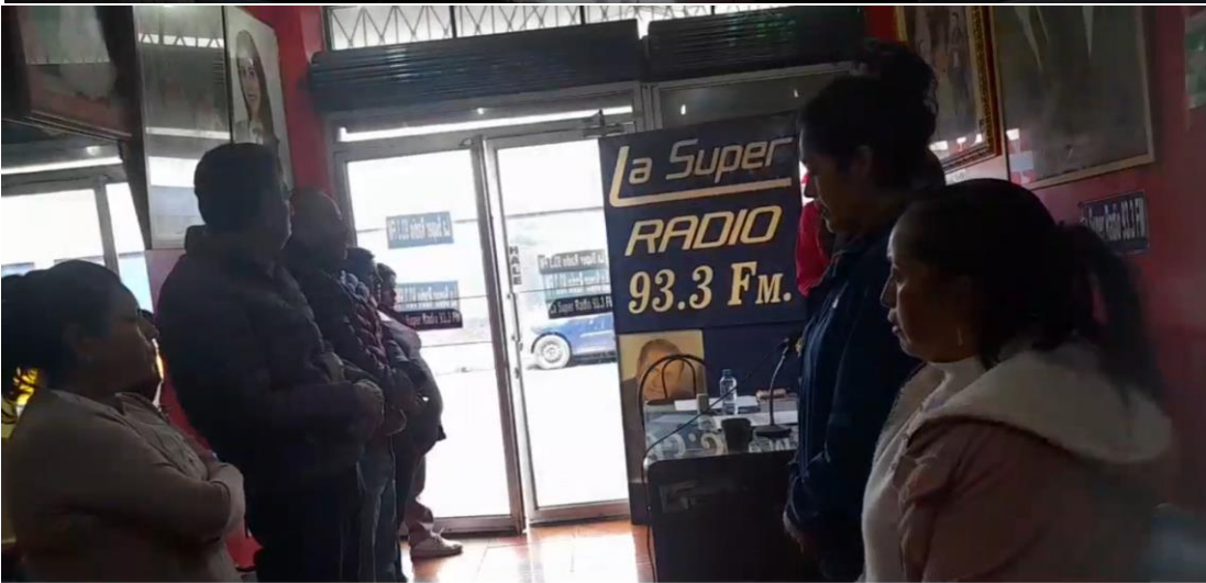
Súper Stereo 93.3 F.M. Rendición de cuentas 2025 - Radio Súper Stereo 93.3 F.M. Rendición de cuenta