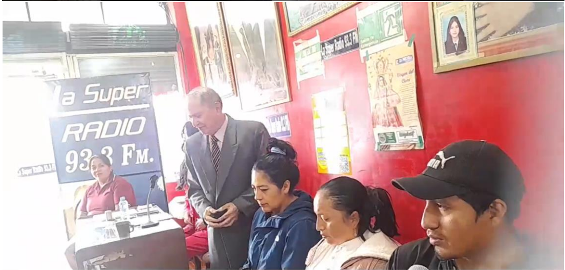
ción de cuentas 2025 - Radio Súper Stereo 93.3 F.M Rendición de cuentas 2025 - Radio Súper Stereo