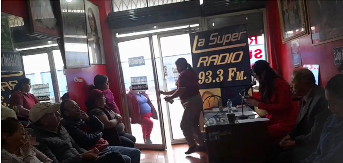
25. Radio Súper Stereo 93.3 F.M. Rendición de cuentas 2025 - Radio Súper Stereo 93.3 F.M. Rendición