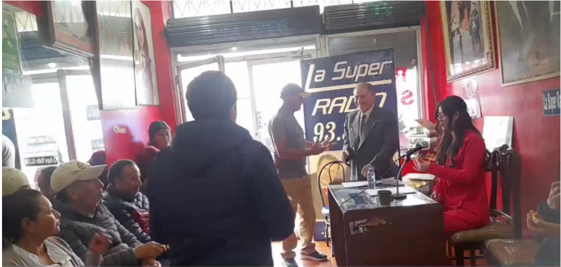
o Súper Stereo 93.3 F.M Rendición de cuentas 2025 - Radio Súper Stereo 93.3 F.M Rendición de cuer