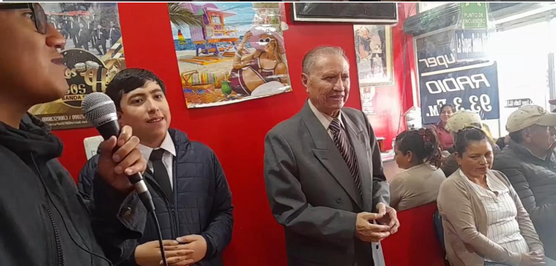
o 93.3 F.M Rendición de cuentas 2025 - Radio Súper Stereo 93.3 F.M Rendición de cuentas 2025 - Ra