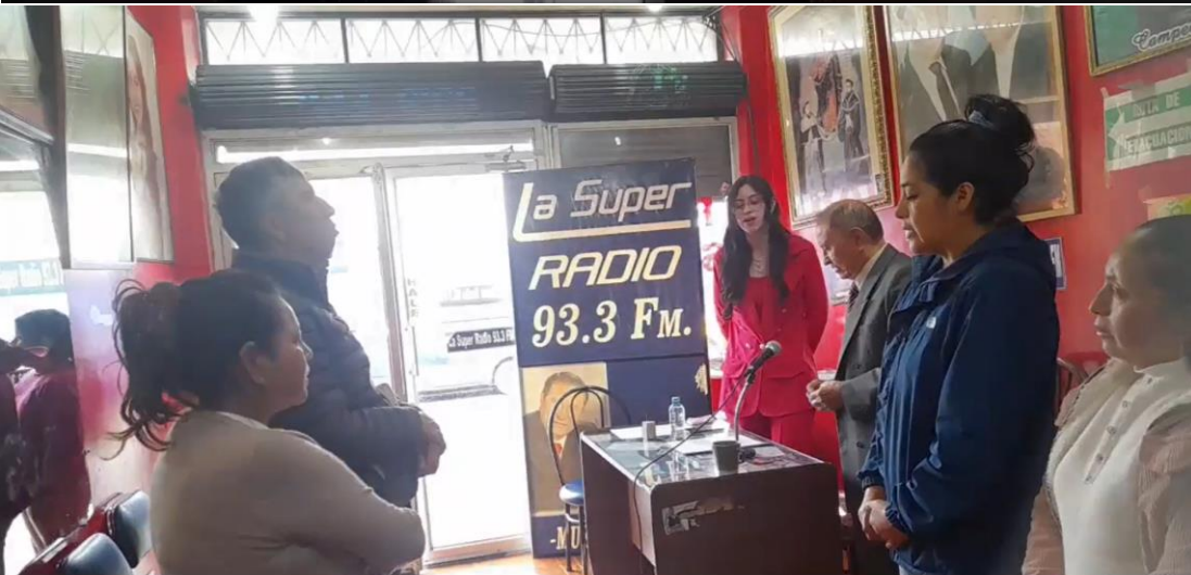
tas 2025 - Radio Súper Stereo 93.3 F.M. Rendición de cuentas 2025 - Radio Súper Stereo 93.3 F.M. R